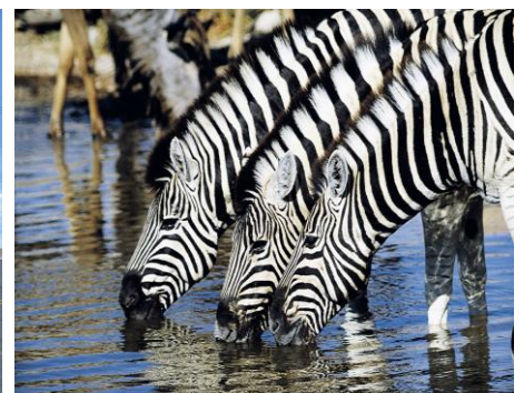
Zebbras im Krüger Nationalpark