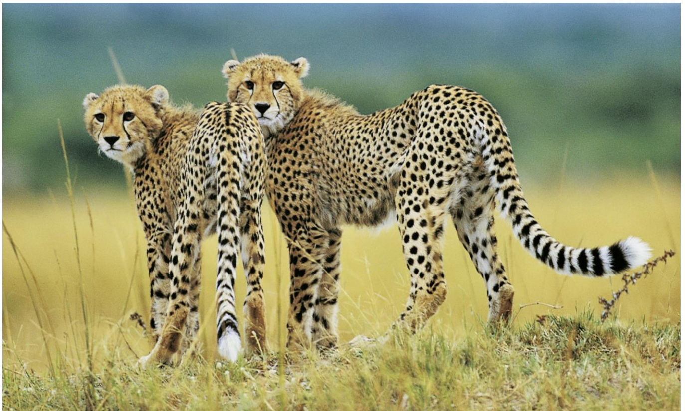
Geparden auf Beobachtung in Südafrika

Lernen Sie während dieser ausführlichen Rundreise die atemberaubenden Gegensätze dieses Landes kennen. Großartige Aussichten am Blyde River Canyon, die einmalige Tierwelt Südafrikas im Krüger Nationalpark, wilde Küsten, Berge, Wälder, Meer und elegante Ferienorte entlang der berühmten Garden Route erwarten Sie. Lassen Sie sich begeistern von den alten Weingütern im bekannten Winzerland hinter dem Tafelberg, dem weltbekannten Kap der Guten Hoffnung und der Metropole Kapstadt, einer der schönsten Städte der Welt.