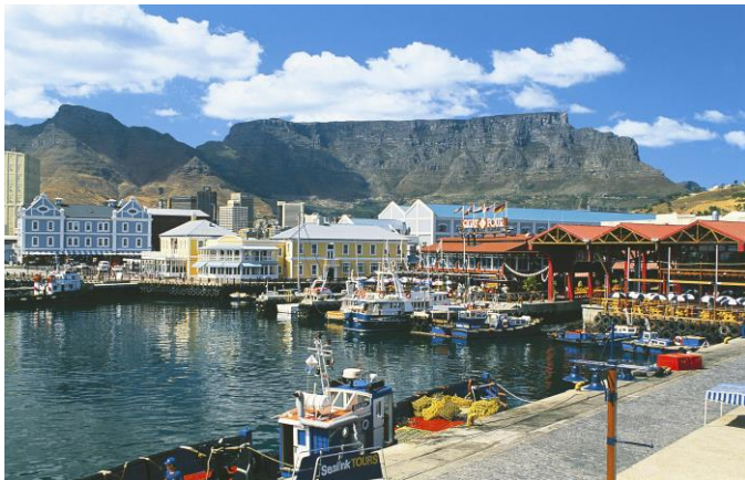
Kapstadt - Tafelberg

Zusätzliche Mahlzeiten und jegliche Getränke, fakultative Ausflüge und Aktivitäten, Trinkgelder und Gepäckträgergebühren (Airport), Reiseversicherungen, alle Ausgaben persönlicher Natur, eventuelle Visagebühren, Rail&Fly. Fakultativ: Cape Malay Kochkurs, ab 5 Personen möglich, Preis: 80,- € (siehe Programm am 24.10.2020).