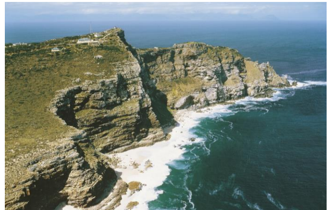
Das Kap der guten Hoffnung