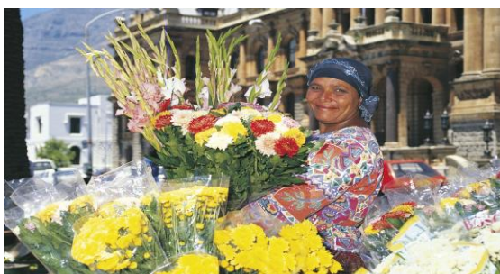
Blumenverkäuferin in Kapstadt

Ankunft am frühen Morgen ca. 07.00 Uhr in München / Flughafen, danach Bustransfer nach Forchheim bzw. Bamberg.