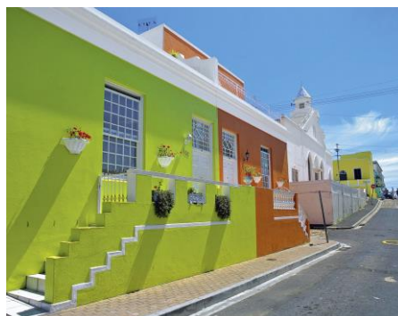
Häuser im Kapholländischen Stil, Bo-Kaap